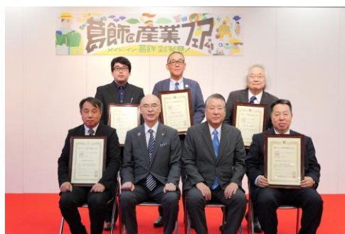
産業フェア認定証贈呈式（R 7）