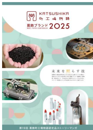
ストーリーマンガ集（R 7）