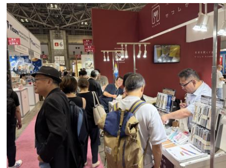
国際雑貨 EXP0 の様子