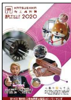
ストーリーマンガ集 (R2)