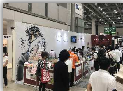
国際雑貨 EXPO の様子